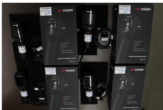
本体 4 台

表面温度計サーモグラフィ ハンディカメラの整備 ( http://site.torikenmin.jp/ )