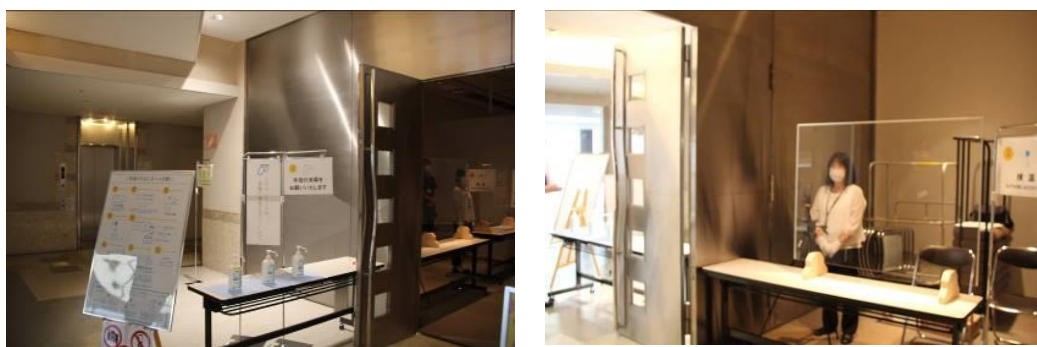
○9/13「音楽っていいな♪キッズコンサート（とりぎん文化会館展示室）」