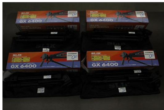
三脚 4 脚